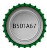
Под крышкой бутылки

8.1.2. Найти уникальный промо-код под крышкой (пример кода XXX000XXXX)