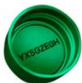
Под крышкой ПЭТ